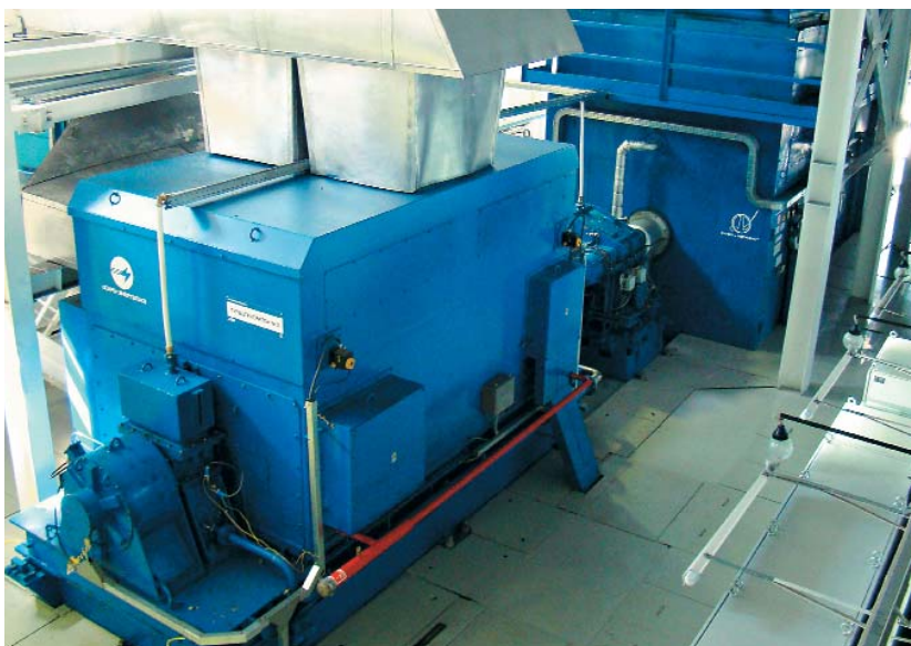
↻ Силовой блок ЗГЭС-16

В ДКС применен винтовой компрессор VP-S21T-52 компании Grasso (Германия). Он обеспечивает высокую надежность оборудования: средняя наработка на отказ не менее 5 000 ч; средний ресурс до капитального ремонта – 40 000 ч. В состав компрессорной станции входит также узел подготовки газа, включающий фильтр для очистки газа от механических примесей, и узел окончательной обработки газа – блок охлаждения, баки продувок, азотная рампа.