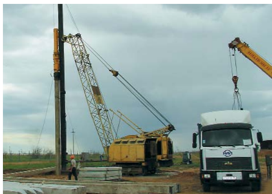
➔ Забивка свайного поля на строительной площадке ПГУ-ТЭС в г. Знаменске

Электрическая мощность от двух турбогенераторов ЭГЭС-16 и турбогенератора паровой турбины выдается через сборные шины распределительного устройства (ГРУ) 10 кВ в составе ПГУ-ТЭС. В ГРУ применена схема «одна рабо-